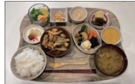
多種類のおばんざいをアゲハ小鉢定食で。その他、メンチカツ・グリルチキンからあげ・お魚定食がご用意されています。

定休日：日曜 モーニング8～10時 ランチ11～14時(L.O.) テイクアウト11～16時(L.O.) 夜(金・土)17～20時(L.O.)