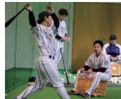
屋内練習場でバッティング

全国へ！」をスローガンに掲げ、都市対抗野球大会や日本選手権、クラブ選手権等の全国大会出場を目指しています。