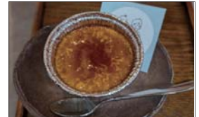
「喜びとしてのイエロープリン」は、オーダーを受けてから表面をパリパリのプリュレタイプに焼き上げます。