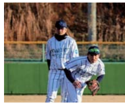
勤務後に守備練習を行う選手

2024年10月に日本野球連盟に加盟し、4月入社の新入社員6名を含め、2025年は20名で活動します。選手たちは社員として毎日午前8時から午後5時まで勤務し、その後に練習しています。「島から