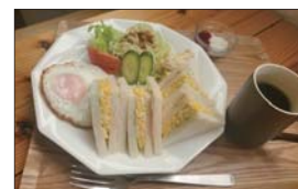
モーニングのサンドウィッチセット。トーストセットは+100円で鳥茶さんのおんバターに変更できます。