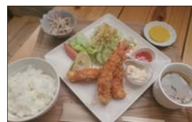
1 番人気は Link ランチ A. 海老のカダイフ揚げ。カダイフのサクサクとした食感と海老の相性は抜群です。

モーニング 8:30～11:00 ランチ 11:00～15:00 ディナー 18:00～22:00 (金・土) 定休日:木曜日