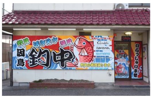
目立つ看板を目印にお越しください

以前あった場所から少し南に移転し、2月10日にオープンしました。以前の店舗の半分ほどの広さになった今回の移転は、立ち退きの話がきっかけでした。お店を閉めるか続けるか正直迷いましたが、釣具屋さんがなくなってしまうと困る方がいるかもしれないと思ったのと、島の方々に支えられてきたという感謝の気持ちから、店を続けることにしました。