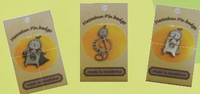
大好評により すぐに完売!

今年もたくさんのお客様に楽しんでいただき、因島の魅力をお伝えすることができました。お越しいただいたお客様や出品して下さった業者様のご協力により、無事に因島観光物産展を開催できたことを感謝申し上げます。