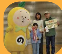
第2回チャンピオンチーム 3rise アダムス・ファミリーチーム

さらに、決勝の高さ競いでは、3rise アダムス・ファミリーチームが昨年の最高記録37.6cmより1.4cm高い39cmに記録を更新しました!