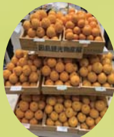
柑橘は例年通り大人気!