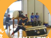
因島村上水軍陣太鼓さん