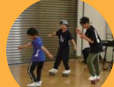
フリースケートチーム 零-ZERO-さん